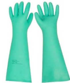
Luva Nitrílica cano Longo