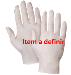
Luva de silicone sem amido

USO OBRIGATÓRIO DURANTE A LIMPEZA DAS ÁREAS