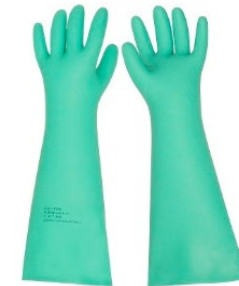
Luva Nitrílica cano Longo – Imersão dos Óculos