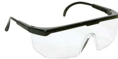
Óculos de Proteção – Lugares altos