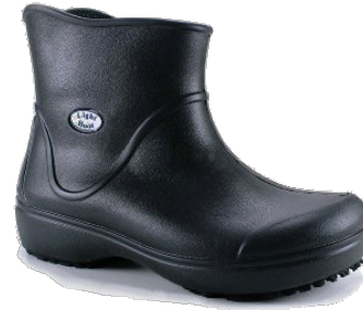
Bota de PVC