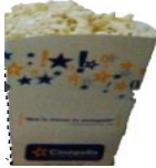
Jumbo 170 oz