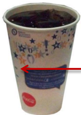
Vaso 42 oz (Jumbo)