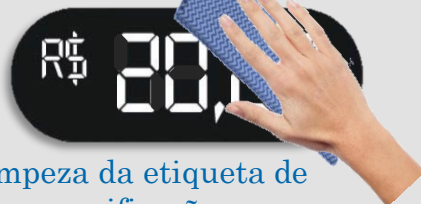
Limpeza da etiqueta de precificação.

IMPORTANTE: É proibido usar produtos químicos não especificado.