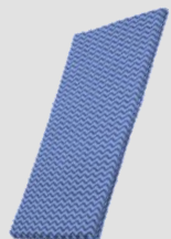
Pano Multiuso azul