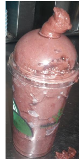
Mala presentación del producto