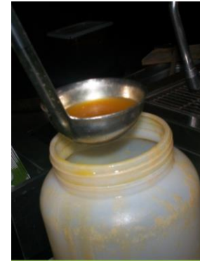
Mala presentación del producto