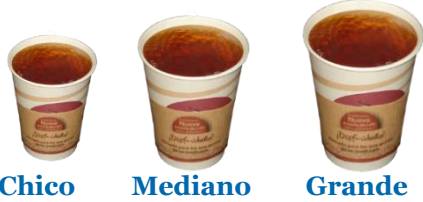
Chico Mediano Grande