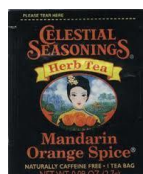
Mandarin Orange Spice