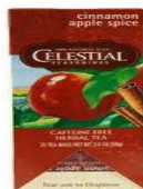
Cinnamon Apple Spice