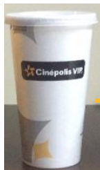
Vaso 20 oz (pequeño)