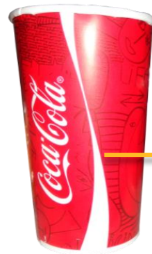
Vaso 44 oz (grande)