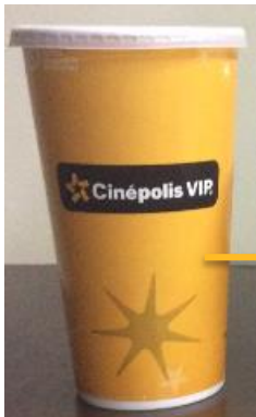
Vaso 32 oz (mediano)