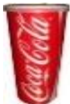
Grande 44 oz