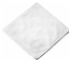
Pano Multiuso Branco