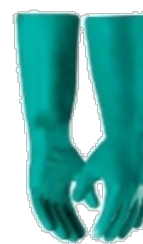
Luva Nitrilica (cano longo)