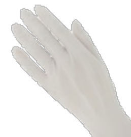
Luva de Silicone (sem amido)