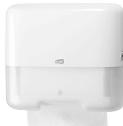
Dispenser de Papel Toalha