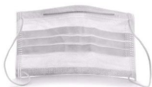
Máscara para Nariz e Boca