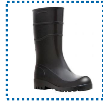
Bota de PVC