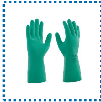
Luva nitrilica curta