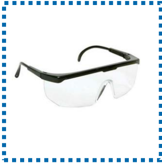
Óculos de proteção