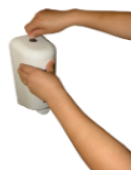
Sanitizante para higienizar as mãos