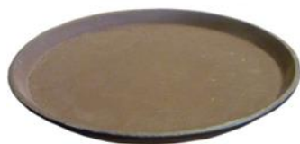
Bandeja de serviço