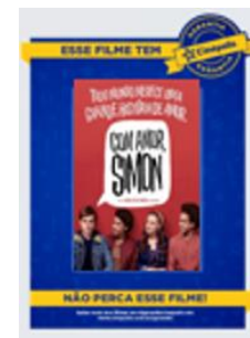
Display em acrílico para Poster.