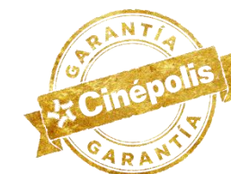
Selo Garantia Cinépolis para Carteleras.